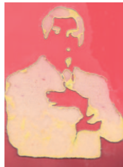
[3-4] Hela Lamine: series Nous ne mangerons plus de ce pain là , 2012 © Hela Lamine [3] 7 November 1987 [4] 14 January 2011

Het volk kwam op straat uit solidariteit met de martelaren van de revolutie, maar ook en vooral om rechtvaardigheid op te eisen. De massa zocht naar